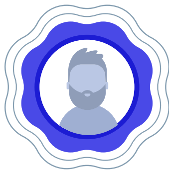
Ketua PTj PENGARAH PPP