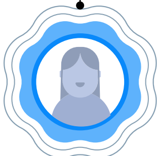
Penyelaras Audit PN. NURHAFIZA BT. MOHAMMAD