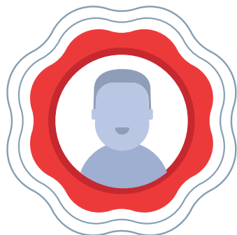
Pengurus Kualiti ZAINUDIN BIN MAMAT